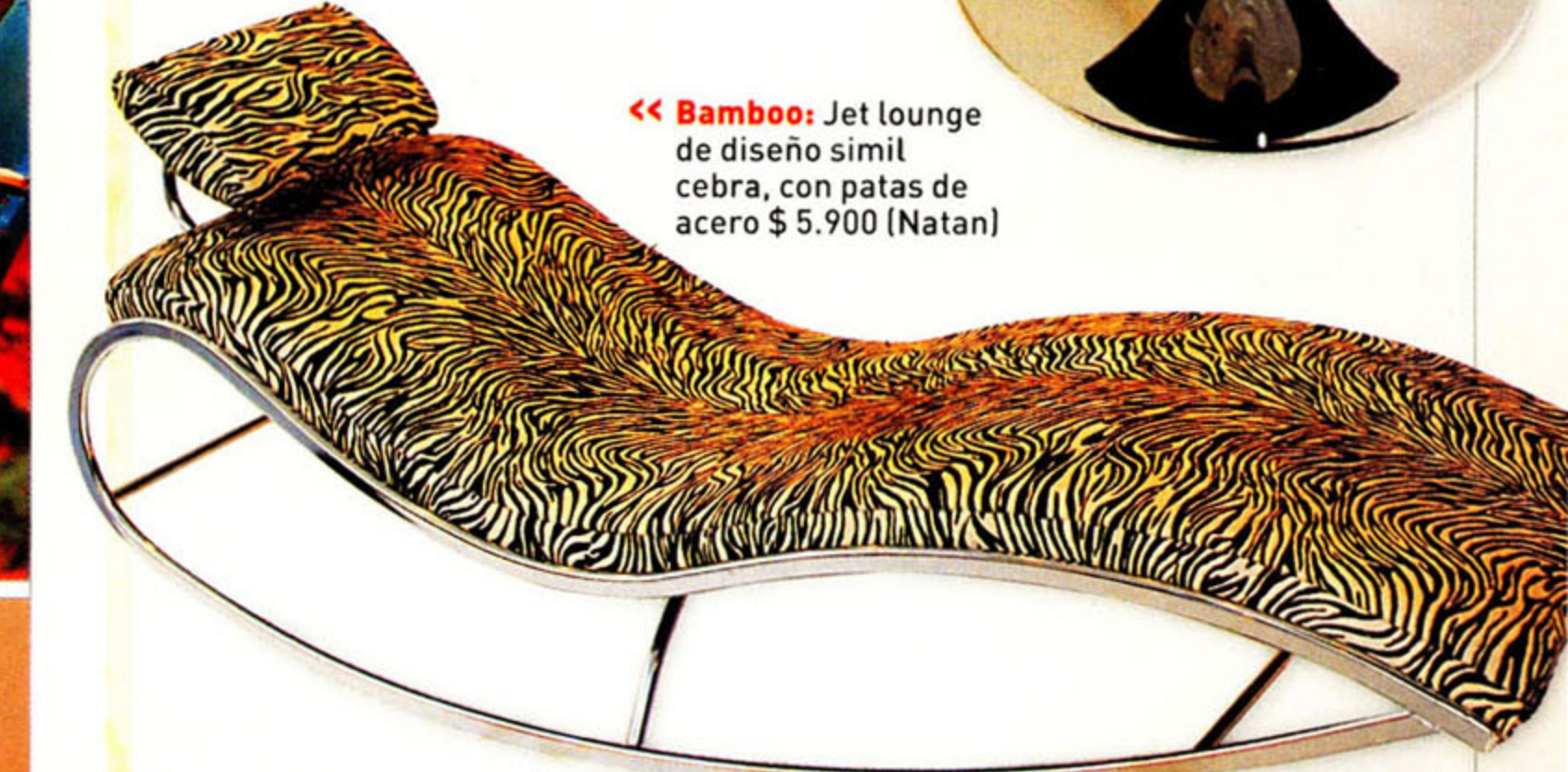
Bamboo: Jet lounge de diseño simil cebrá, con patas de acero $ 5.900 (Natan)

Cuero, madera y acero, los básicos para una silla de corte moderno. Animal print y efecto croco entre los estampados y texturas elegidas.