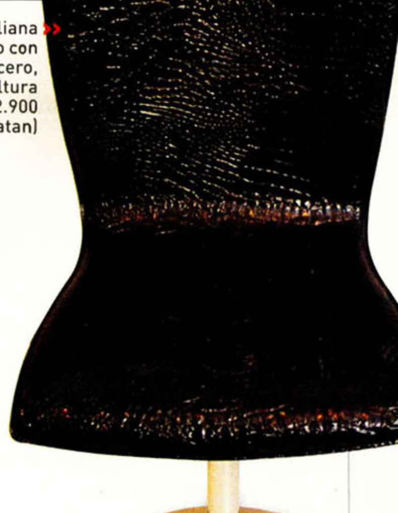
Silla Hip: Silla Italiana de croco charolado con base de acero, giratoria y altura regulable $ 2.900 (Natan)