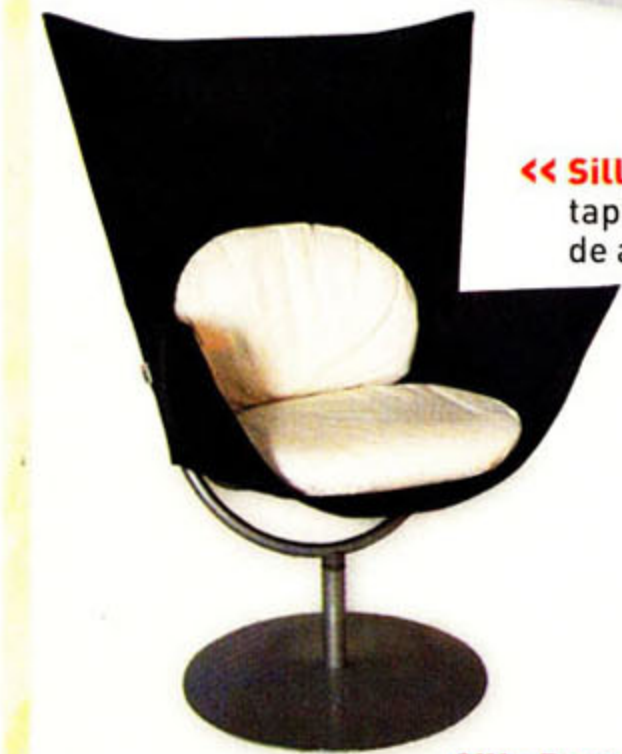
Sillón Spak: Sillón giratorio tapizado para exterior, base de acero $ 2.290 (Natan)