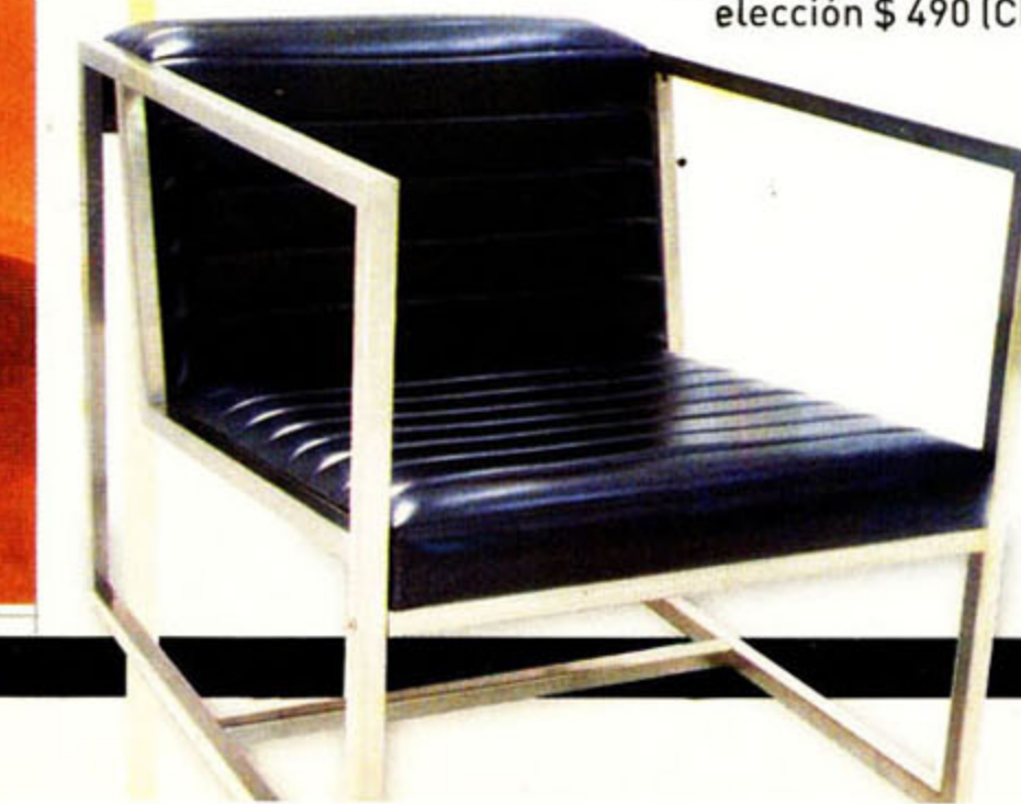
Sillón Frog: Sillón con asiento en cuero negro, montado sobre estructura geométrica en cromo satinado. $ 2.360 + IVA (Matriz)