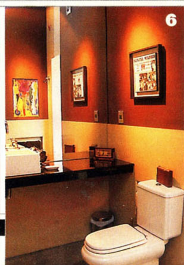
2 Mesa en acero y vidrio y lámpara de acero años '50 compradas en el Mercado de Pulgas. Sillones años '50 (San Telmo). 4 Cocina: mesada en cemento alisado. Puertas en Wengué y paredes forradas en chapa galvanizada. 5 Desayunador en wengué. 6 Baño: mesada en mármol negro. Bacha cuadrada DECA y porcelanato de Barugel Azulay.