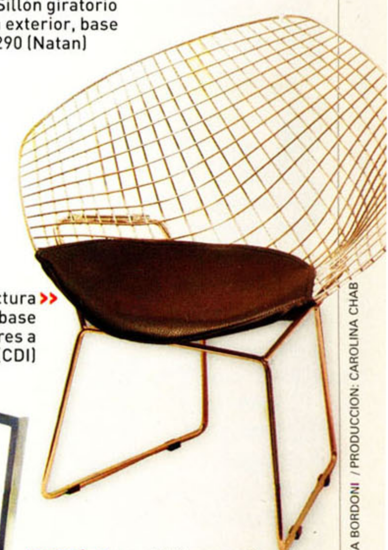
Silla Bertoia: Estructura de hierro cromado y base de ecocuero. Colores a elección $ 490 (CDI)