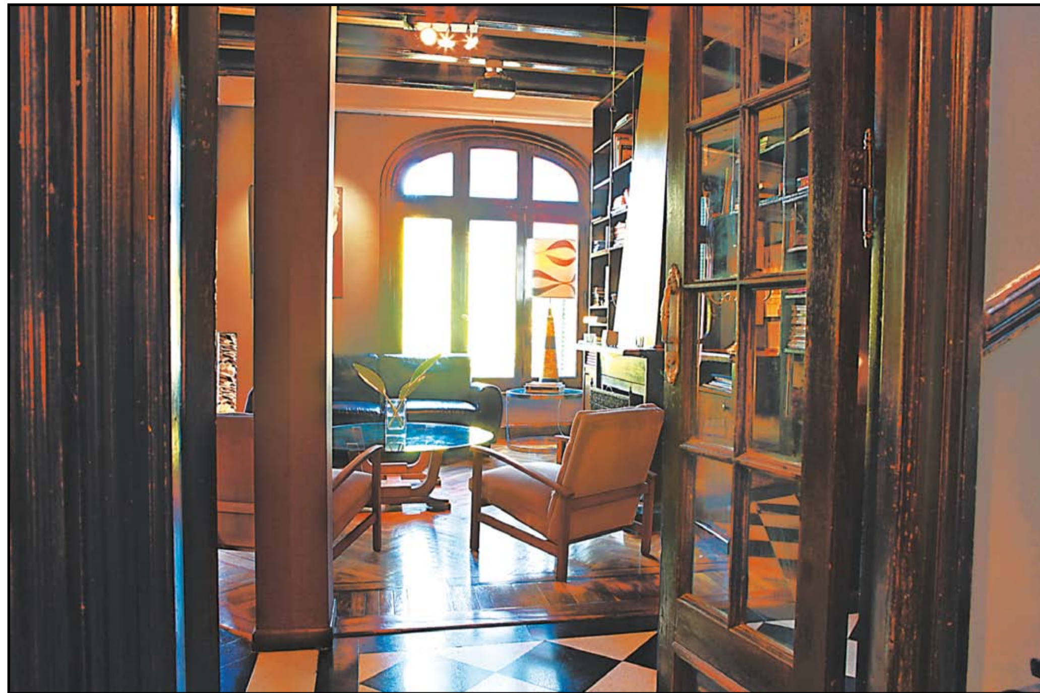
DE PUÑO Y LETRA. El dueño de casa compró personalmente cada uno de los elementos de la decoración: un ejemplo puede verse en los sillones chester de cuero rojo en el living de la casa.

Una esquina de Palermo, de evocaciones borgeanas, es la base a partir de la que el decorador madrileño Javier Echenique imaginó su propia casa: color, audacia, diseño y tecnología para conectar el pasado y el mejor de los futuros.