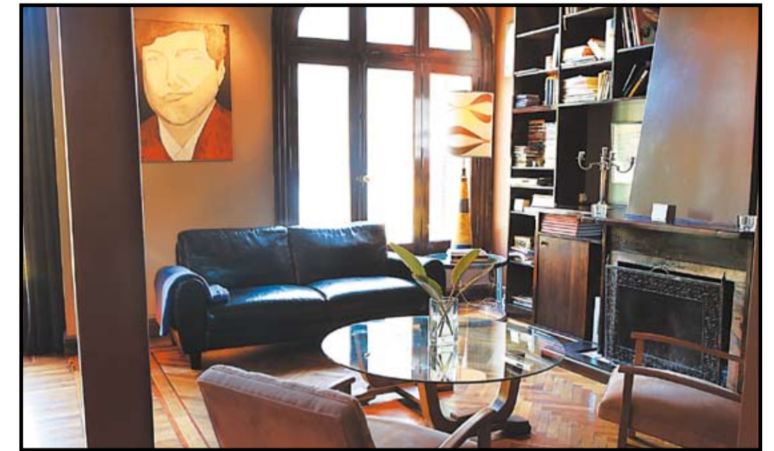
DE ESTILO. Para hacer la obra se levantaron los techos un metro, para volver al volumen original.

Textos: Pablo Helman. Producción: Delfina Inchauspe. Agradecimientos: Javier Echenique; www.echenique.com.