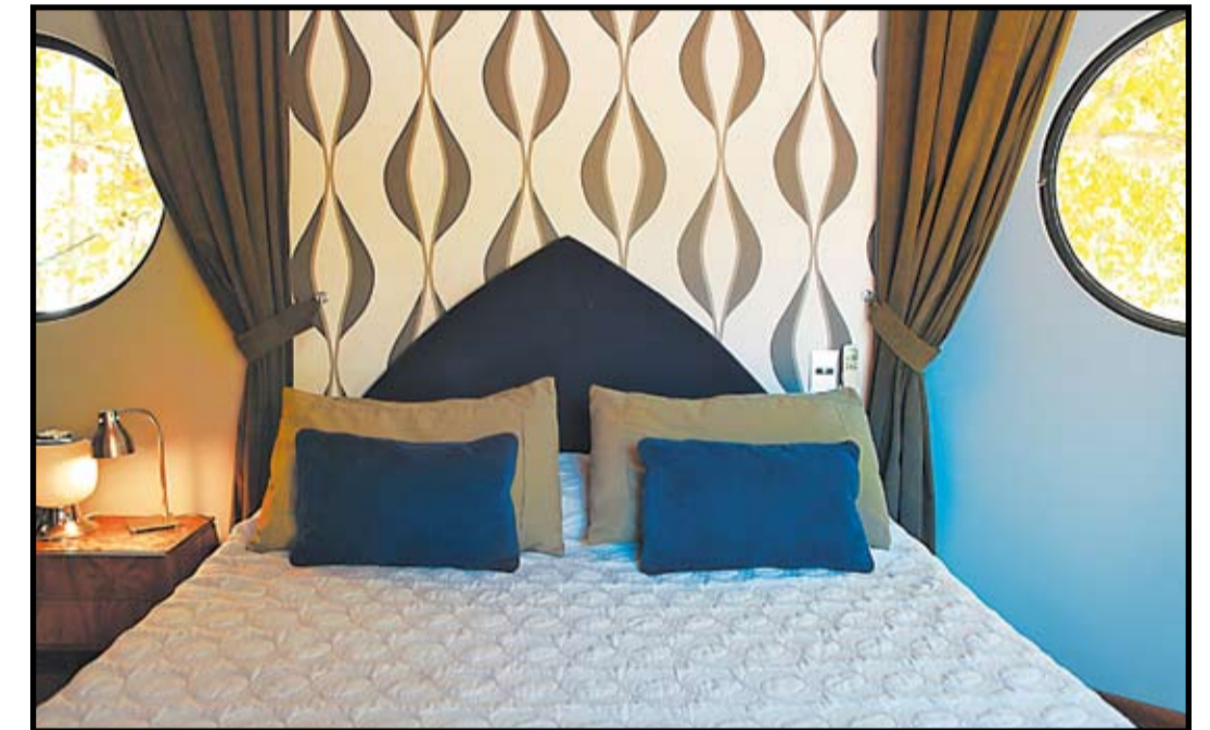
JUEGO DE LUZ. En el dormitorio principal, es atractivo el equilibrio entre luz natural y lámparas.